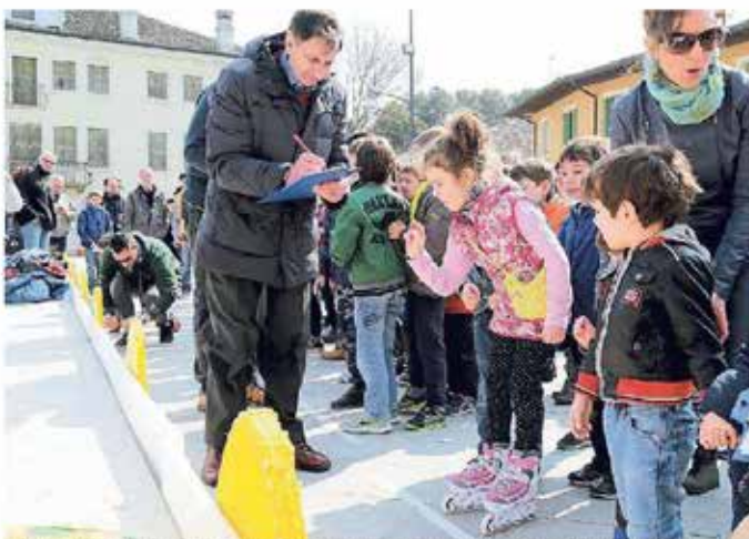
L'edizione 2016 della tradizionale gara del "Tiro a l'ou" organizzata dal Circolo Brandl in piazza Libertà

Nella sua ultima seduta, la giunta ha stabilito il riparto di 16mila euro tra 11 realtà associative, una cifra alla quale si aggiungeranno con l'assestamento di bilancio altri 3.200 euro destinati alla Proloco Turriaco e all'Auser. La parte del leone la fa lo sport e in particolare il Fo.Re. Turriaco cui sono stati assegnati 6.470 euro per la «cura costante dell'area sportiva e il grande impegno nel settore giovanile». Lo stesso che caratterizza la Polisportiva Libertas, attiva nella pallavolo, cui sono andati tremila euro. Anche nel settore culturale è stata premiata l'attività educativa nei confronti dei giovani. Alla Filarmonica con la sua