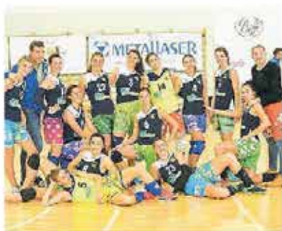
La Friulana ambientale Rizzi sabato si è imposta in quattro set sul Volley Codroipo

C donne. Il posto di comando della graduatoria femminile è stato conquistato, sabato, dalla Virtus Trieste, che è riuscita a espugnare, per 3-1, il campo di un Maschio Buja troppo discontinuo. Le giuliane sono così salite a quota 18, lasciandosi alle spalle, a meno due, il terzetto di provinciali costituito da Libertas Majanese, che si è imposta in tre set sulla Domo-vip Porcia. Banca di Udine Volleybas, che ha riposato, e Hotel Collio Rojalkennedy, che si è sbarazzato senza colpo ferire, per 3-0, del Borgo Clauiano Trivignano. Va detto che Virtus e Majano devono ancora riposare e che proprio sabato andrà in scena il derby fra Volleybas e Rojalkennedy, un al-