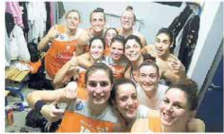
Le ragazze della Delsier subito dopo la vittoria contro Carugate