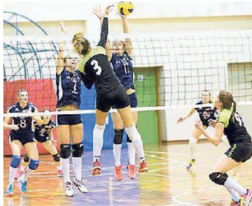
Banca di Udine ha avuto la meglio sull'Hotel Collio Rojalkennedy col punteggio di 3-0

Le udinesi, che hanno già riposato, si trovano due punti sotto le giuliane e si sono lasciate alle spalle anche la Libertas Majanese, protagonista