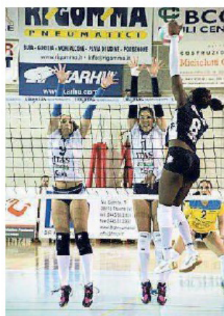
L'Itas vuole mantenere la vetta