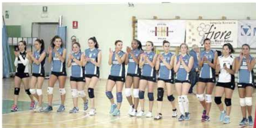
GRUPPO SANVITENSE Le pallavoliste della Cap Arreghini di San Vito al Tagliamento applaudono i loro tifosi a fine gara