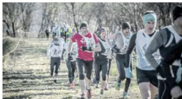
CORSA CAMPESTRE Scatta la stagione del cross con tanti pordenonesi

GIOVEDÌ PROSSIMO IL DEBUTTO UN CALENDARIO RICCO. IL 28 GENNAIO TOCCHERÀ AL MEMORIAL BERTOLIN