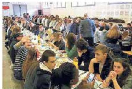
Il pranzo sociale di fine anno con i giovani atleti della Libertas Sacile