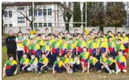
Alcuni giovani del minirugby del Pedemontana Livenza Polcenigo