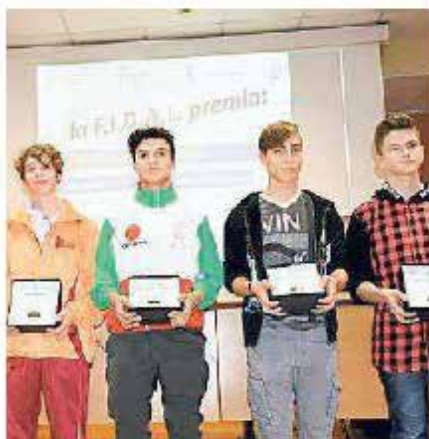
Ecco alcuni dei giovani atleti della Destra Tagliamento premiati ieri

Festa dell'atletica provinciale e regionale ieri alla sala Die-moz a Porcia. Premiati gli atleti che nel 2017 si sono distinti nell'attività su pista a entrambi i livelli: sono stati assegnati i riconoscimenti ai protagonisti dell'edizione 2017 di Atletica Giovani, alla rappresentativa provinciale impegnata nel trofeo giovanile internazionale "Città di Majano", alla selezione pordenonese che si è distinta al trofeo delle province di Borgoriccio, ad atleti che si sono distinti in campo nazionale ed internazionale e a tecnici, giudici e dirigenti.