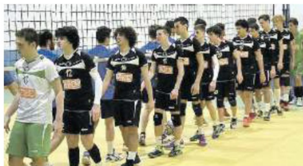
CORDENONESI I ragazzi della Calor Domus Futura che militano in D

Dalle 15 di oggi si disputa il torneo "Volley e sapori d'autunno", la kermesse dedicata come ogni anno alla categoria under 12 e 13. Il torneo organizzato da società insieme per Pn è diventato un appuntamento imprescindibile per le società locali, che da sempre hanno apprezzato l'impeccabile organizzazione e l'approccio coinvolgente e divertente con cui le giovani promesse affrontano la manifestazione. Le società partecipanti sono in tutto 19 e provenienti dal Friuli Venezia Giulia e dal Veneto. Per la categoria under 13 gareggiano Insieme Per Pordenone Volley, Pallavolo Fiumicello, Upd Costa (Treviso), Juvenilia Volley, Rizzi Volley, Rojalkennedy Volley, Polisportiva Santa Giustina (Belluno), Pallavolo Portogruaro (Venezia), U. S. Cordenons, Blu Volley, Stella Volley. Under 12: Insieme Per Pordenone, Juvenilia Volley, Chions Fiume Veneto, Libertas Martignacco, Pallavolo Susegana, Union Volley, Est Volley, Cordenons. Gli incontri avranno luogo negli impianti sportivi cittadini di Borgomeduna, PalaGallini e via Vesalio, con le finali che si svolgeranno domani dalle ore 16, nel palazzetto di via Ungaresca. L'evento ha come obiettivo, inoltre, lo sviluppo turistico del Friuli occidentale grazie alla collaborazione di attività artigianali del Pordenonese che domani pomeriggio esporranno i loro prodotti. A fine torneo gli Alpini organizzeranno una castagnata per tutti. (r.p.)