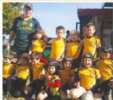
Il minirugby a Maniago