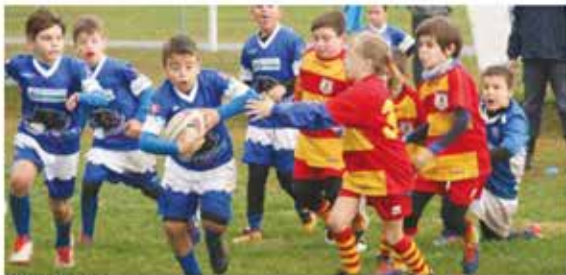
Minirugby a San Vito