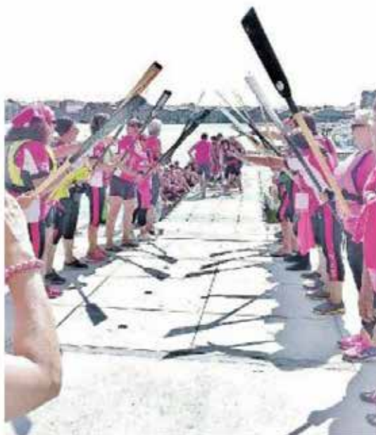
SUL PODO Le donne in rosa festeggiano il loro argento a Venezia