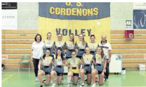
RAGAZZE L'organico femminile dell'Astra Mobili di Cordenons