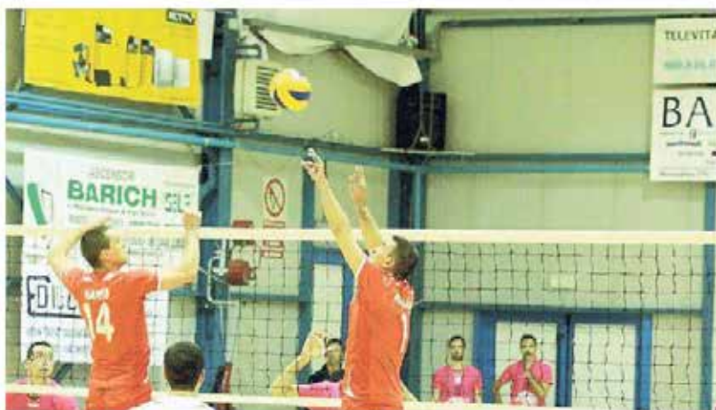
Kante dello Sloga Tabor mentre si prepara per una schiacciata

In C regionale, turno infrasettimanale con quattro gare in programma. Mortegliano fa piazza pulita del Vbu e si conferma capolista solitaria, men-