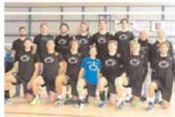
Futura Cordenons segnalato per l'attività maschile

È notevole avere ben cinque società riconosciute nel territorio pordenonese: tanto per