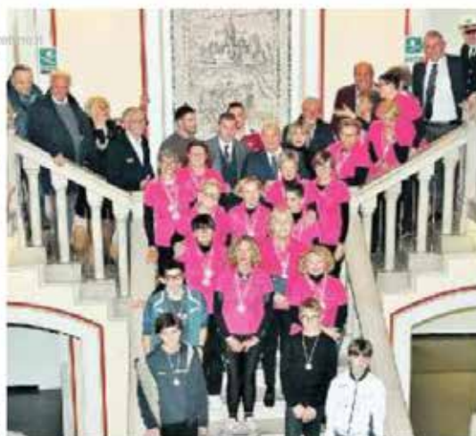
PREMIATI Gli studenti sportivi che hanno ricevuto i riconoscimenti

«Lo sport - ha commentato il sindaco Alessandro Ciriari - è un valore culturale e insieme sociale, e uno strumento di integrazione. Insegna a vincere e a riconoscere quando l'avversario è più forte. È un'attività che, abbinata allo studio, rende i ragazzi consapevoli delle proprie potenzialità e responsabilità, perché nulla è regalato e i risultati, sia a scuola che nello sport, sono il frutto del proprio lavoro e impegno. Le risorse che destiniamo allo sport sono un investimento per il futuro, in questi ultimi tempi abbiamo speso oltre 3 milioni di euro per gli impianti. Sono intervenuti anche gli assessori Walter De Bortoli, Pietro Tropeano , e il consigliere delegato all'istruzione Alessandro Basso , rappresentanti del Coni e dell'Ufficio scolastico regionale e, per il Panathlon, il presidente Lucio Marcandella , che ha illustrato le finalità del sodalizio.