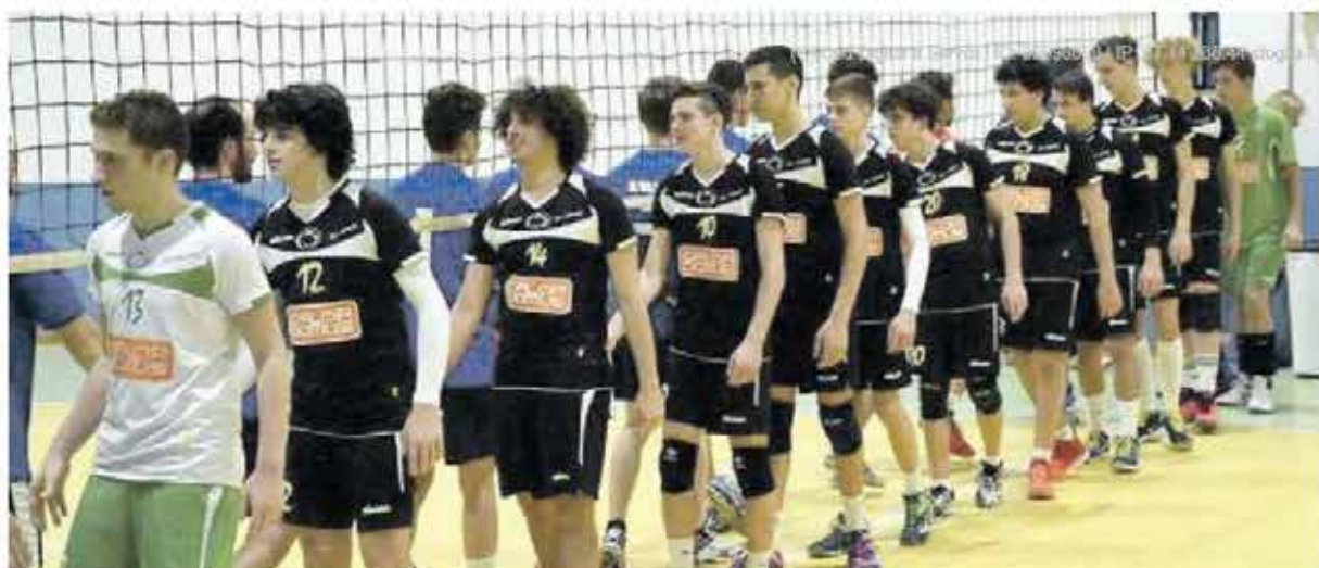
CORDENONESI I giovani talenti del Futura di Cordenons sono in vetta al campionato regionale di serie D con il marchio Calor Domus