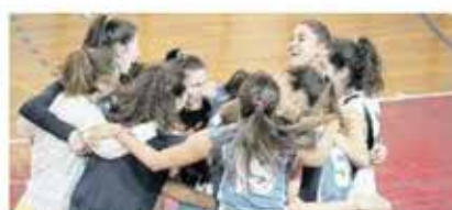
LE SANVITESI IN ASCESA Cap Arreghini: le ragazze si abbracciano dopo aver ritrovato il successo

Domani alle 12 c'è il derby maschile a Cordenons nella palestra della scuola Da Vinci. L'imbattuta Calor Domus (7 sigilli in altrettante gare disputate, per 21 punti) ospiterà il Prata (17), che