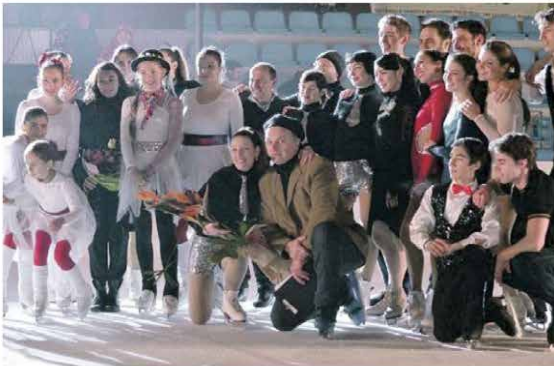
SPORT Il gruppo sportivo di giovani del Ghiaccio Pordenone Libertas asd. Ora ha fuso la squadra di hockey con quella americana