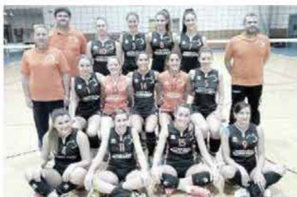
PRONTE AL DERBY ROSA Organico e staff tecnico della Cecchinese Impresa Vazzoler