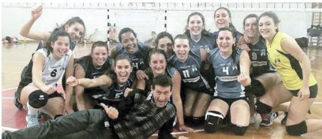
GIOIA IN PALESTRA Festa finale in casa della Cap Arreghini di San Vito dopo il successo nel "quasi derby" con il Portogruaro