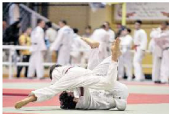
SUL TATAMI Massiccia partecipazione al Trofeo Città di Porcia

I FRANCESI DEL COLMAR AL SECONDO POSTO NELLA CLASSIFICA DEDICATA ALLE SOCIETÀ