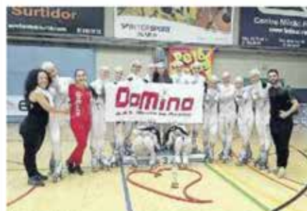
SKATE IN SACILE Le ragazze del gruppo Domino che sono giunte terze al Trofeo delle Nazioni che si è tenuto in Spagna

«PER LA NOSTRA SOCIETÀ QUESTO TERZO POSTO È COME UNA VITTORIA. SIAMO ARRIVATI A SOLI 10 CENTESIMI DI PUNTO DALLE PRIME»