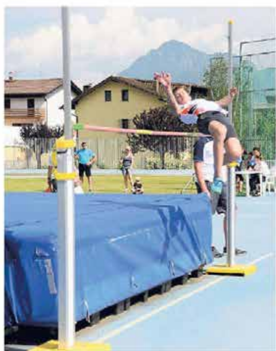
L'impianto di salto in alto gestito dalla Libertas di Tolmezzo

relazione Martini - oltre ad aver spostato al gabbia di lancio del martello, danni che abbiamo provveduto a riparare con le nostre forze, ma il saccone del salto è stato sollevato dal vento e danneggiato irreparabilmente. Per questo, quando abbiamo visto il bando regionale per l'acquisto di attrezzatura sportiva, abbiamo presentato richiesta. Il contributo copriva l'80 per cento dei 13 mila euro di costo - ragguaglia Martini - ma una decina di giorni fa gli uffici regio-