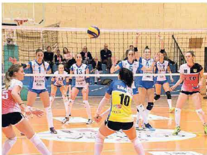
L'Itas Martignacco schierata: vittoria importante