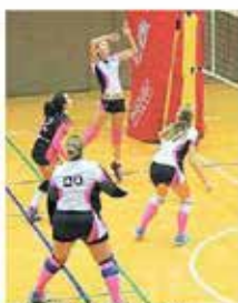
In azione dell'Ecoedilmont