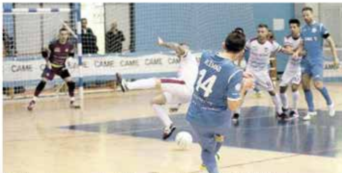
SERIE C Il campionato regionale di calcio a 5 vive nel segno della Martinel di Pordenone

IL PROSSIMO TURNO IN CASA DELL'UDINESE VITTORIA A TAVOLINO PER IL MANIAGO ARRIVO DEL POGGIO