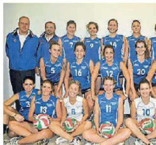
Alcune atlete del Sant'Andrea

La Majanese sconfigge 3-2 il S. Andrea ma è un punto d'oro quello guadagnato dalle ospiti, che lottano strenuamente dal terzo e riaprono una gara fattasi in salita sul 2-0 casalingo. Equilibrio punto dopo punto fino a parità 12/12, leggero break Majano ricucito subito dal Santa che tiene botta fino al 23/23; ma la Libertas sfrutta subito il cambio palla e chiude il set 25-23. Similare l'andazzo anche nella ripresa: equilibrio e piccoli scatti, S. Andrea a condurre fino al 15-19, poi match di nuovo riportato sulla linea del 21 pari e da lì il rush nell'epilogo per la squadra di casa che confeziona un 2-0 pe-