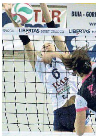
L'Itas gioca domani a Martignacco