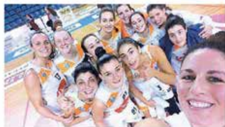
Il selfie post-partita della Delser non manca mai, e porta pure bene

tita evidenziano la serata poco felice al tiro dalla lunga distanza di entrambe le squadre (nessuna tripla realizzata nei rim 20') e un attacco cagliaritano spuntato anche da vicino a canestro: con il 21% al tiro non si va lontano. Al rientro dagli spogliatoi Cagliari tenta la rimonta disperata, la Delser allenta un po' la tensione e si arriva al 26' con la gara nuovamente aperta sul 37-31 con Ridolfi in lunetta per il potenziale -4; l'esterna ospite fa 0 su 2 e capitan Vicenzotti punisce lo spreco con una tripla scacchapsensier, prelude a un filotto di 7 punti personali che rispediscono il Cus a -15 (46-31) alla