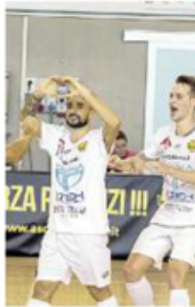
PRATESI Esultanza in casa del Maccan Prata che milita in B

In serie C la capolista Martinel Pordenone vuole la settima vittoria consecutiva in campionato. Dopo la larga affermazione della scorsa giornata (un netto 8-0 con tripletta di Grzelj, un centro ciascuno per Sola, Kamencic, Perin, Accatante e Finato) nel derby con il Maniago, domani alle 15.30 i nero-