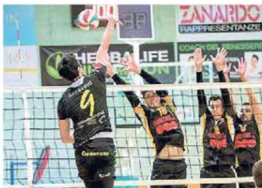
Non sono bastate le schiacciate di Saraceni per piegare lo Sloga

con il coltello tra i denti. La paratenza dello Sloga è molto lanciata e la Martellozzo è costretta a inseguire, 16-9. La svolta tanto attesa non c'è per gli ospiti, arriverà solo più tardi. Intanto lo Sloga dilaga e bombarda tutte le postazioni difensive degli azzurroverdi: 25-15. È il parziale più difficile disputato dalla Mar-