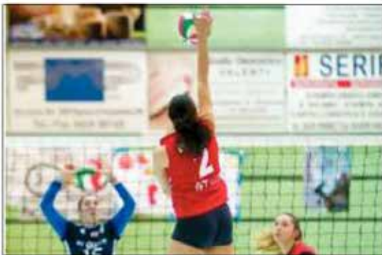
SFIDE Cameli (Insieme): schiacciata vincente; a destra le roveredane

Maschi: il Prata ha scavalcato in graduatoria la Vb Udine. Dopo i successi su Olympia e Sloga, i mobiliari hanno battuto a Trieste il Lussetti. Il podio più basso è stato ottenuto anche grazie alla concomitante sconfitta degli udinesi nel derby d'alta classifica a Buja. Francesco Bon-