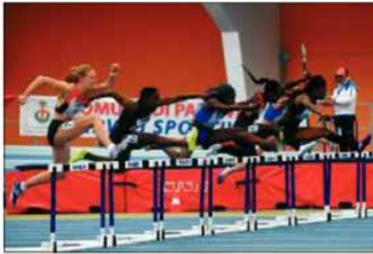
INDOOR Nuovo appuntamento nazionale nel palazzetto di Ancona