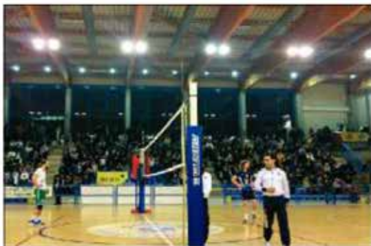
Una fase di Prata-Motta e, a destra, la gioia dei cordenonesi