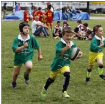
SFS Intec Fontana Rugby

Con la macchina organizzativa già roduta durante il raggruppamento di minirugby dello scorso novembre, la SFS Intec Fontana Rugby , affiliata Libertas, si appresta ad organizzare il suo primo Torneo , in programma il 26 marzo 2017 allo stadio Tognon in Viale dello Sport a Fontanafredda.