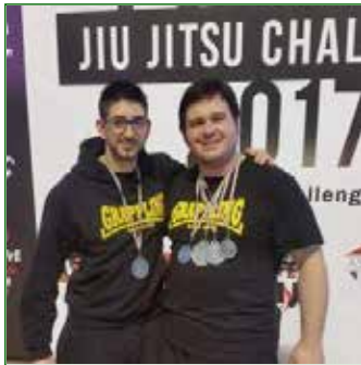
Judo San Vito Libertas