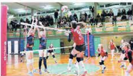
Un attacco di Insieme per Pordenone nel big match di Staranzano

personale di 11,44; Tommaso Scianinnanka (Sacile) si migliora nel salto con l'asta, vola a 3,35 ed è terzo mentre Nell'Antoni (Sacile), dopover contratto il personale nei 60 piani con 7'53 (dodicesimo) chiude al secondo posto nella 4x200 con l'75'51. Prove positive anche per Tommaso Petris (Casera) nell'800 (1,73) e per Luca Basile (Sanvitese) nel lungo (5,93). (a.ber.)