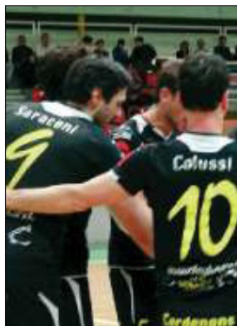
LE "PANTERE" CORDENONESI