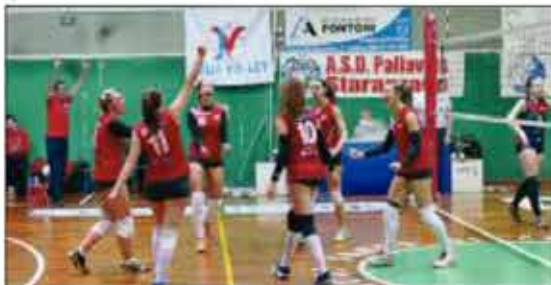
INSIEME L'esultanza delle ragazze della capolista pordenonese