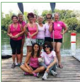
Donne in rosa

Un altro passo a compimento del grande progetto che è la Scuola Nazionale Libertas di Canoa "Barbara Nadalin" , promosso dalla Libertas provinciale e dal Gruppo Kajak Canoa Cordenons con la posa in opera di un nuovo pontile sul Lago della Burida che renderà possibile e più sicura l'entrata in acqua anche per i soggetti affetti da disabilità o difficoltà motorie.