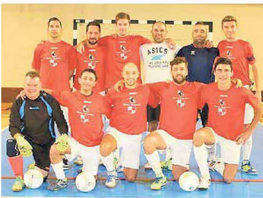
La formazione della Sanvitese Albatros, che sogna i playoff in serie D Csi

Calcio a 5 Csi, bella vittoria sulla Pizzeria da Nicola e terzo posto consolidato nel torneo di serie D