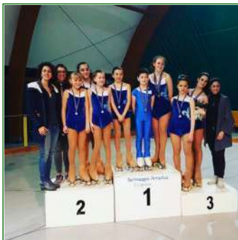
Pattinaggio Libertas Porcia

Due giorni intensi di gare sono stati affrontati dal Pattinaggio Artistico Libertas Porcia per il Campionato Provinciale di Pordenone svoltosi il 4 e 5 marzo ad Azzano Decimo, dove l'Associazione purilliese, grazie al notevole aumento delle iscrizioni, ha potuto far gareggiare ben 14 atleti , di cui la metà al proprio debutto assoluto.