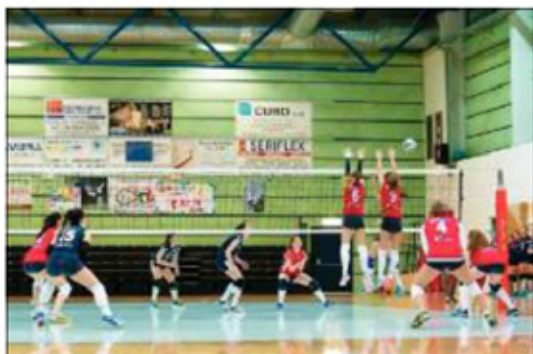
PRIME Insieme per Pordenone allunga il passo in serie C femminile

Maschi: a Prata ride il Gs Favria di San Vito. I mobilieri, reduci da due battute d'arresto di misura consecutive