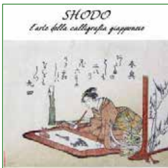
Polisportiva Villanova - Yume

La collaborazione ante litteram fra la Polisportiva Villanova Libertas e l' Associazione Culturale Giapponese Yume , che si occupa di diffondere la cultura giapponese in Italia e quella italiana in Giappone grazie ad una fitta rete di conoscenze, permetterà al 34° Trofeo Villanova di arricchirsi di un ulteriore evento che si svolgerà domenica 12 marzo presso il Palazzetto dello Sport in Via F.lli Rosselli 4 a Pordenone.