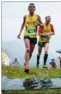
IN MONTAGNA Di corsa in salita