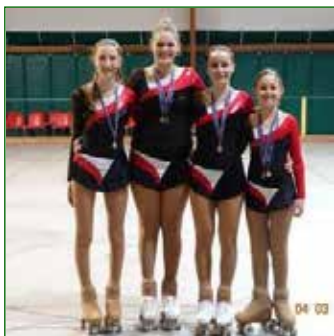
Skating Club Pordenone