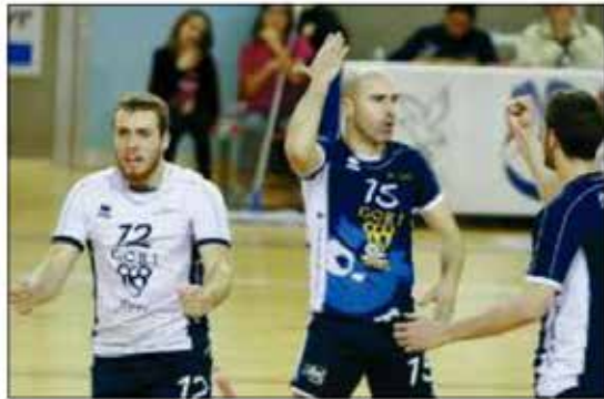
PRATESI I "passerotti" della Gori Wines celebrano il successo