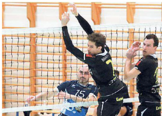
Decisive legocate a muro per la Martellozzo Cordenons