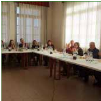
Pattinaggio Libertas Porcia

Non un semplice pranzo sociale, ma il suggello di una collaborazione fruttifera fra il Pattinaggio Libertas Porcia e lo Skating Club Comina , è stato ufficializzato ieri 22 gennaio 2017 al Villaggio del Fanciullo.