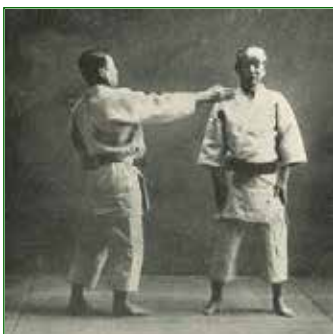
Skorpion Club Libertas

Grande prova dello Skorpion Club Libertas Pordenone domenica 23 gennaio alla prima tradizionale tappa del Grand Prix d'Italia di judo kata a Giaveno (TO), dove era presente con due coppie delle 70 provenienti da ben otto nazioni in gara .