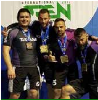
Judo Club San Vito