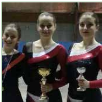
Skating Club Pordenone

Uno Skating Club Pordenone d'argento ha partecipato venerdi 14 e sabato 15 aprile al Jolly International Trophy 2017 – IV Memorial Giuseppe Levi di Trieste, gara di pattinaggio per squadre miste a sorteggio.