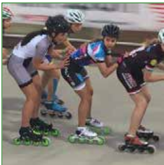
Pattinaggio Libertas Porcia

Diventano internazionali le Frecce Azzurre del Pattinaggio Libertas Porcia che dal 21 al 23 aprile sarà con due atlete alla tappa tedesca dell' European Cup Inline , all' Arena Geisingen International , dove dovranno affrontare 900 dei migliori pattinatori d'Europa.