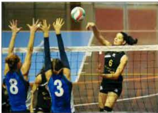
MURO GIALLOBLU' La Friultex domenica si giocherà la salvezza

MARTELLOZZO - Riscatto centrato per la Martellozzo che in casa ha travolto il Bibione. «I ragazzi hanno voluto dimostrare di che pasta sono fatti - sostiene l'allenatore Gianluca Saraceni -. Abbiamo battuto una squadra motivata con capacità e grinta. Sono soddisfatto di come la squa-