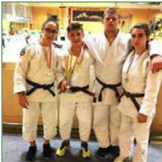
Polispportiva Tamai Judo